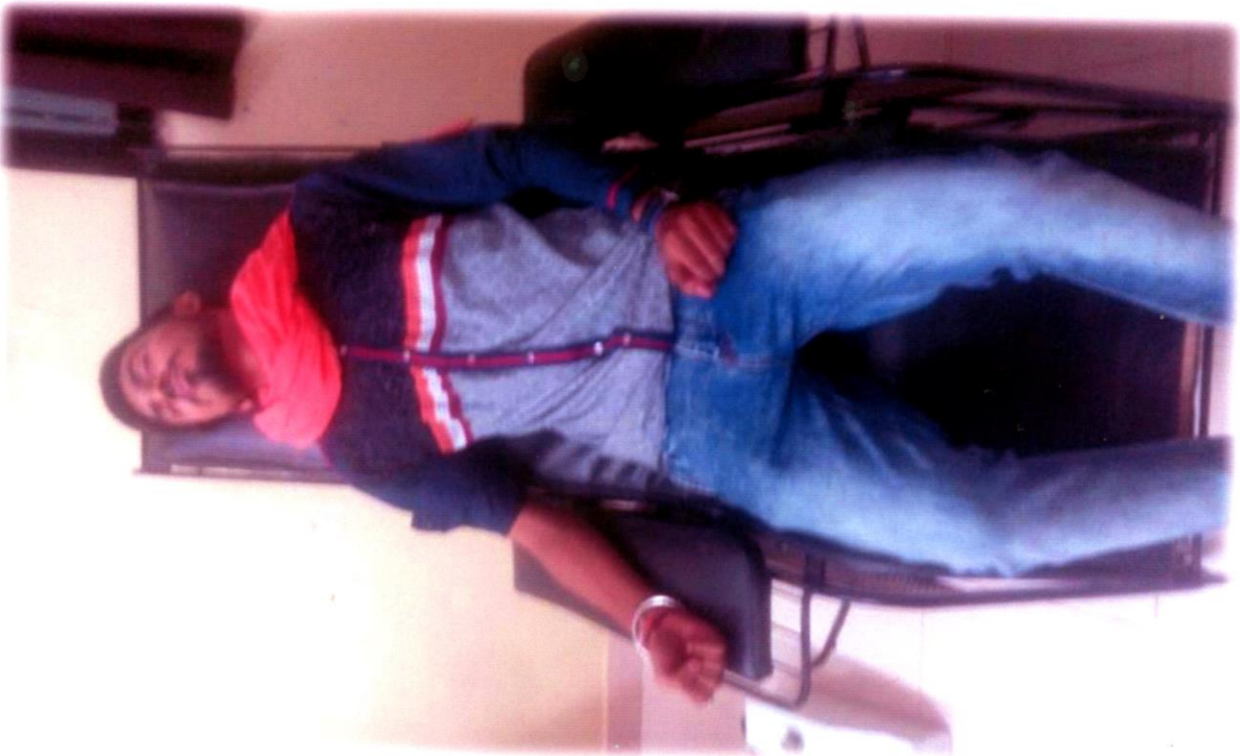
Volunteers, Donating blood